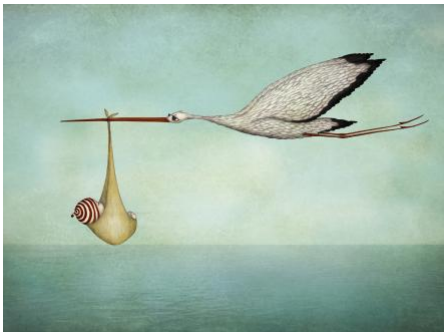
Livraison de bébé par la cigogne

Quand les cigognes sont là, le monde est en bon état.